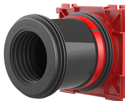
De getoonde afbeelding kan afwijken van het gekozen product

Voor de eenzijdige aansluiting van systeemafdichtingen voor kabels (binnenzijde) en van mantelbuizen (buitenzijde).